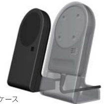
オプション：ケース

狭いレジ周りには分離型タイプ。制御部はレジ下などに設置ができ、必要な時にタッチ部だけをお客様へ差し出してかざしてもらえるので設置場所を選びません。